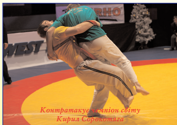
Контратакує чемпіон світу Кирил Сорокотяга