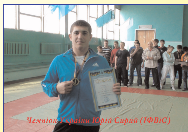
Чемпіон України Юрій Сирий (ІФВіС)